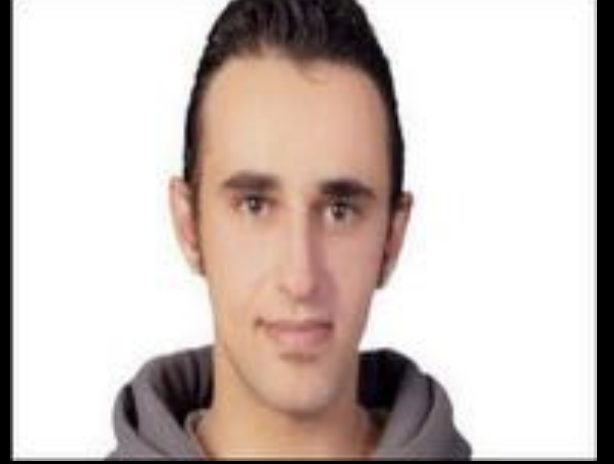
صورة خالد سعيد وهو حي يرزق