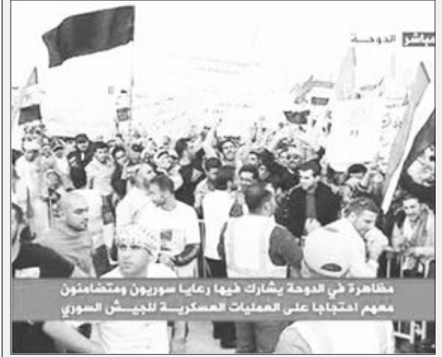
مظاهرة في الدوحة يشارك فيها رعايا سوريون ومتضامنون معهم احتجاجاً على العمليات العسكرية للجيش السوري

خرجت مسيرات في سلطنة عمان وقطر والأردن وفي محافظة ذمار اليمنية تضامناً مع الشعب السوري وتنديداً بالعمليات التي يقوم بها الجيش النظامي السوري في حق المدنيين في عدة مناطق وعلى رأسها محافظة حمص.